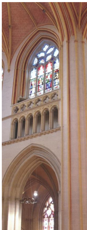
DÉCORATION DE L'ESPACE